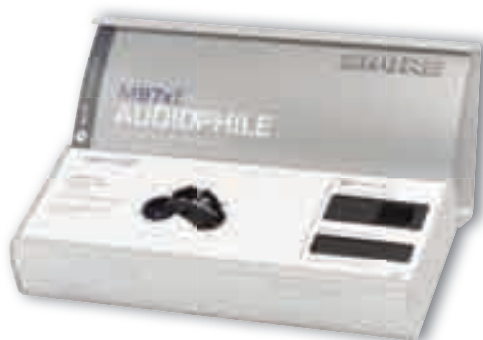
Custodia M97xE con accessori